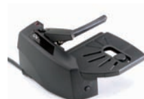
Lurlyftare GN1000 RHL

9950112 Issue 2, 2009-12. Vi reserverar oss för ändringar i utförande och specifikation utan föregående meddelande.