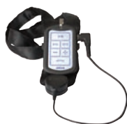
Bluetooth Solution Kit