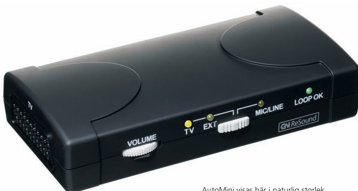
AutoMini visas här i naturlig storlek

AutoMini är liten och behändig att ta med på resan eller till sommarstugan. Du kopplar den enkelt till den TV-apparat du vill titta på. Du kan välja din egen TV-volym överallt, utan att störas av eller störa någon annan.